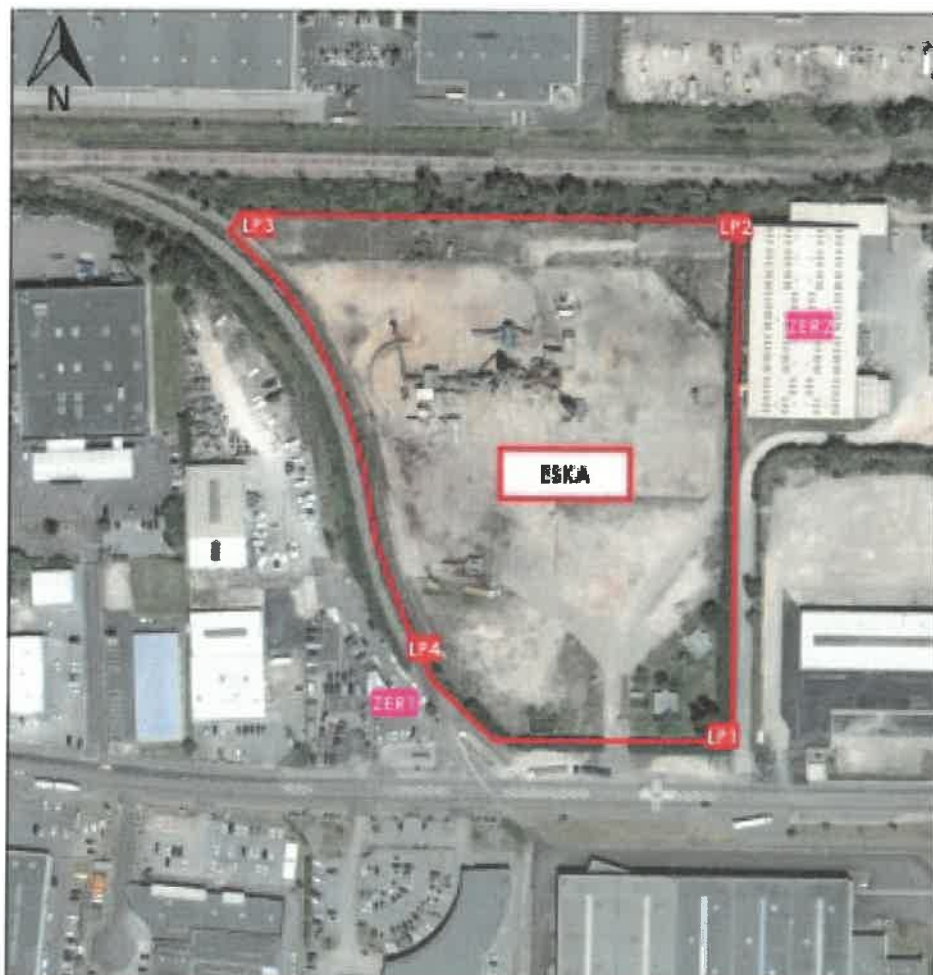
Figure 34 : Localisation des points de mesure des émissions sonores (Hors-échelle)

Vu pour être annexé à notre arrêté en date de ce jour Mâcon, le 10 DEC. 2020